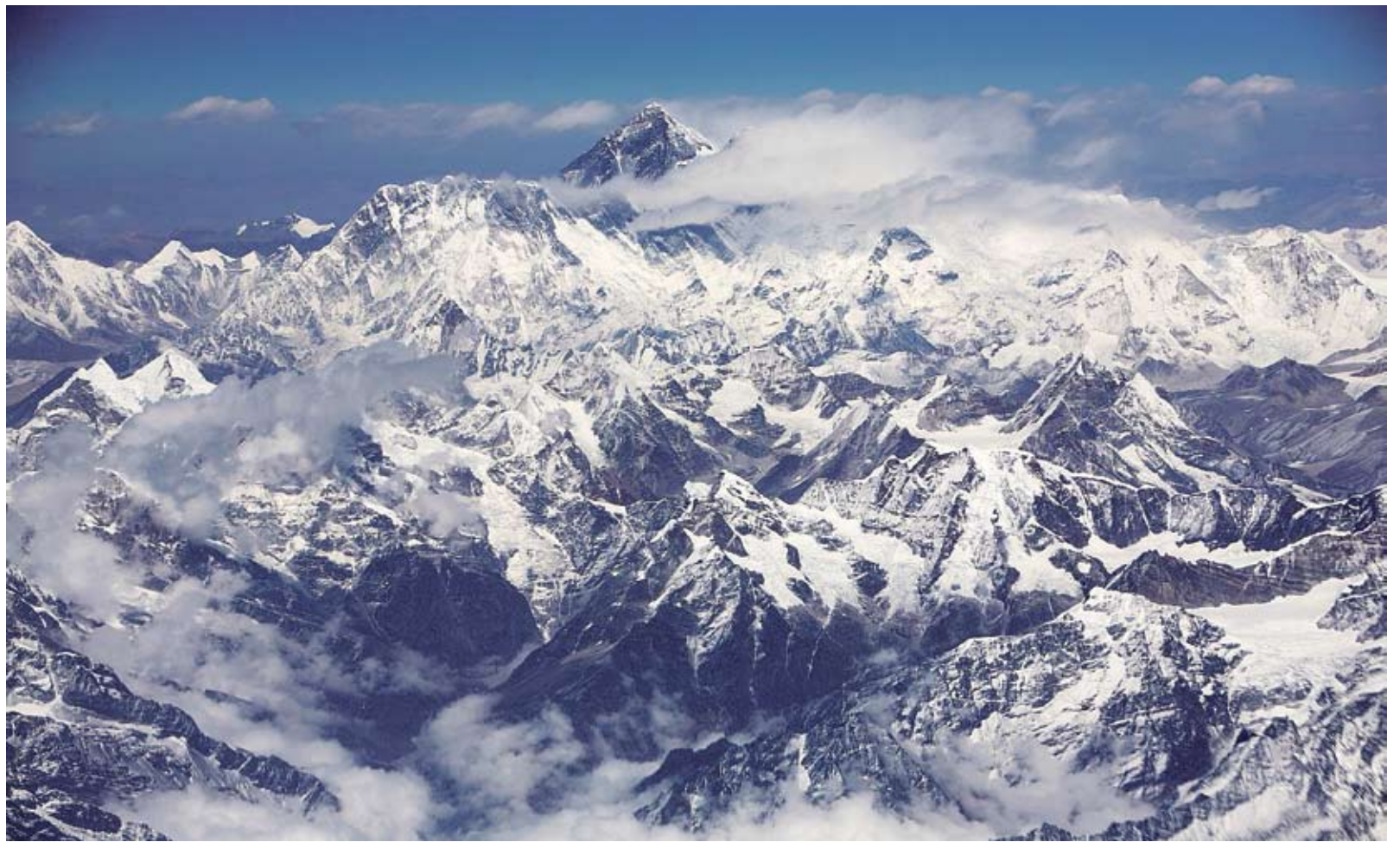
► VILNIAUS UNIVERSITETO žygeivių klubas pasiryžęs dar vieną pasaulio viršukalnę pavadinti lietuvišku vardu.

Anot jo, Kunlunas išliko mažai ištirtas iki šių dienų. Tai liudija faktas, kad į aukščiausią regiono viršūnę „Kongur Tagh“ pirmą kartą įkopta tik 1981 m., o geografai iki šiol nesusitaria dėl tikslaus jos aukščio (7.720 m ar 7.650 m). Regione vis dar daug itin aukštų (per 6.000 m) žmogaus kojos neliestų viršūnių, mat čia retai užklysdavo alpinistų ekspedicijos. Kunluno šiaurėje plyti didžiulė Gobio